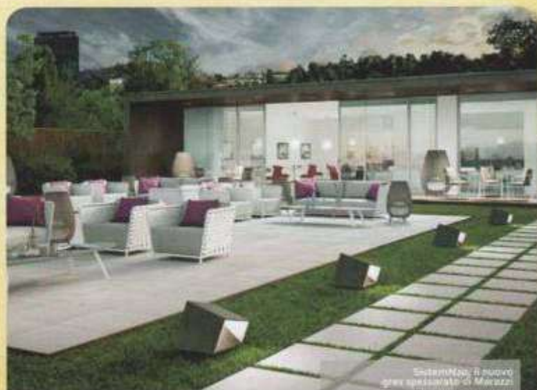
SistemNo: il nuovo graz specialista di Macazzi